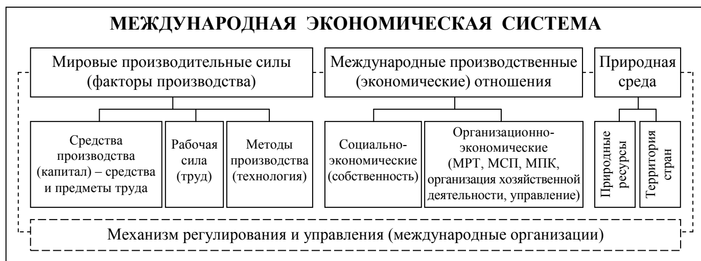
Рис. 1 – Международная экономическая система

Международная экономическая система рассматривается как результат взаимодействия всей совокупности мирохозяйственных связей (социально-экономических и организационно-экономических) и производительных сил (факторов производства, ресурсов) с задействованием механизма регулирования и управления, как система качественно высшего уровня, чем простая совокупность национальных экономик разных стран ( рис. 1 ).