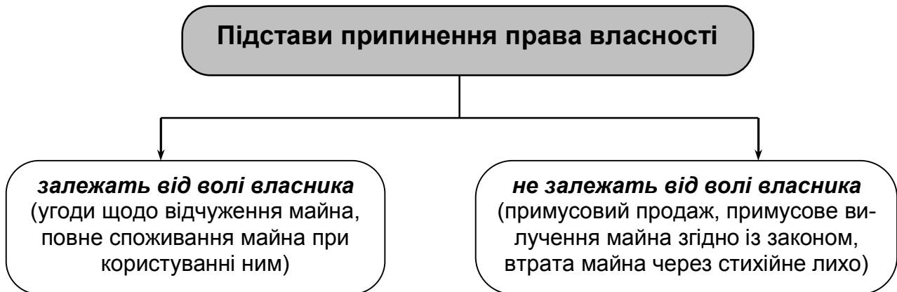
Рис. 2 Підстави припинення права власності

Економічні перетворення відносин власності в процесі сучасної економічної реформи, що передбачає запровадження ринкових форм господарювання, здійснюються шляхом: