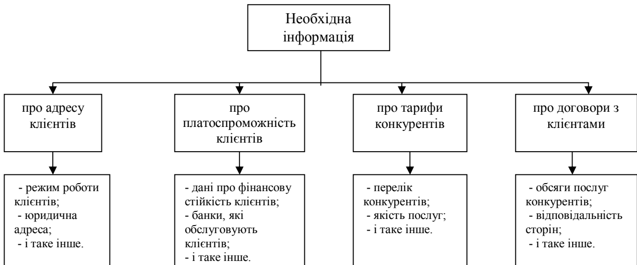
Рисунок 3 – Приклад схеми джерел отримання інформації (дані для прийняття управлінського рішення стосовно заданої проблеми)