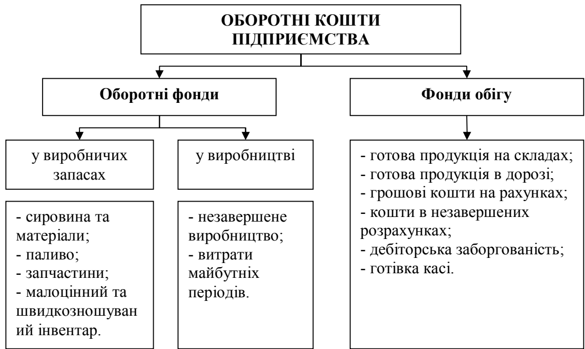
Рисунок 4.1 – Склад оборотних коштів підприємства

Розглянемо головні класифікаційні ознаки оборотних коштів підприємства: