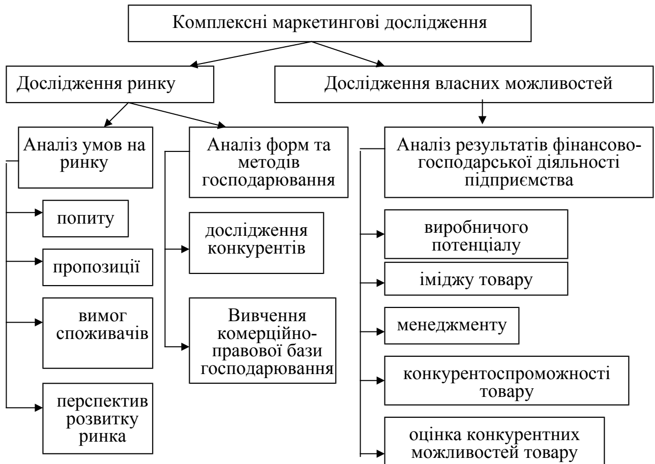
Рисунок 4.1 - Структура комплексних маркетингових досліджень

3. позиціонування товару на ринку - забезпечення конкурентного положення товару на ринку і розробка комплексу маркетингу.