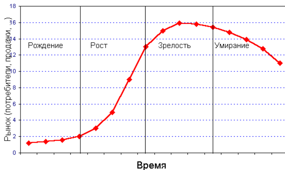
Рис 1. Крива життєвого циклу товару

Етапи життєвого циклу товарів - характеристика основних ринкових параметрів особливостей маркетингових стратегій і технологій впливу на ринковий попит.