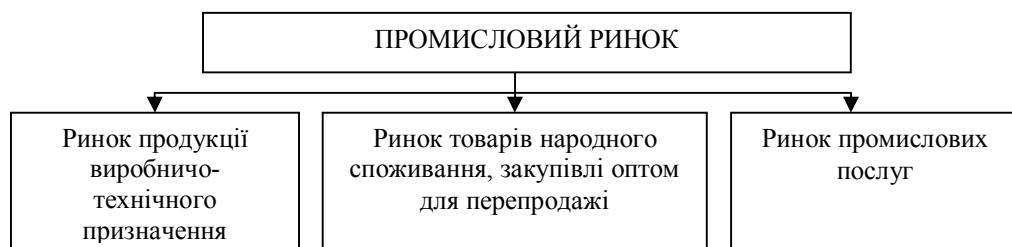
Рис.1. Структура промислового ринку

Промисловий ринок будемо розуміти як ринок, що складається з ринку ПВТЦ, ринку ТНС, реалізованих оптом, і ринку промислових послуг (мал. 1).