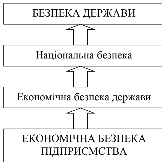
Рис.1.2. Структурно-функціональний зв'язок між економічною безпекою підприємства та безпекою держави

Таким чином, аналізуючи інформацію, наведену на рисунку 1.1, можна відзначити, що між поняттями безпека держави та економічна безпека підприємства існує наступний структурно-функціональний зв'язок – економічна безпека підприємства формує економічну безпеку держави, національну безпеку в цілому та значним чином впливає на загальну безпеку держави (рис. 1.2).